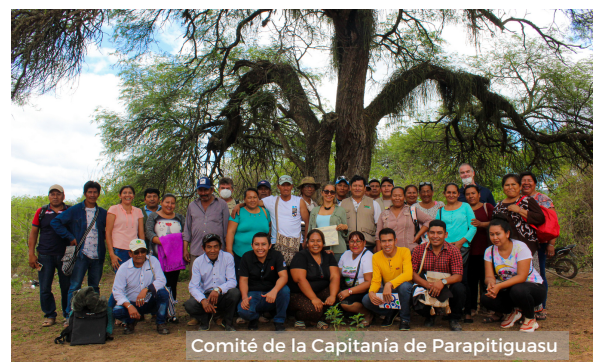
Comité de la Capitanía de Parapitiguasu