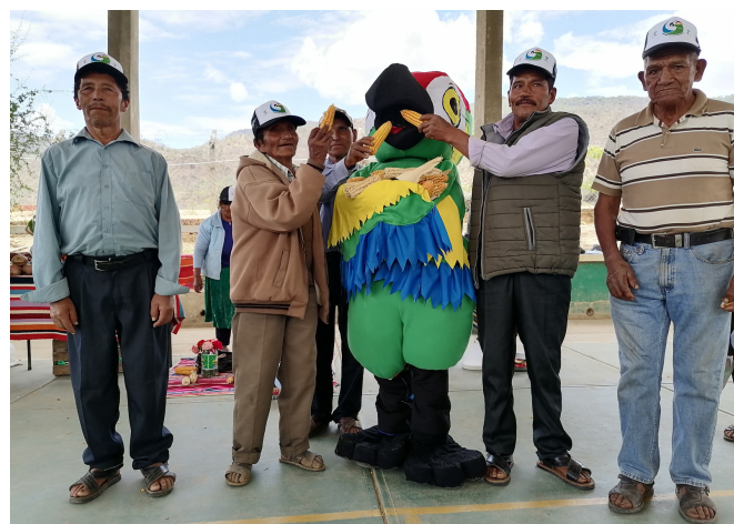
Comunarios de Oconi que firmaron Acuerdos de Conservación