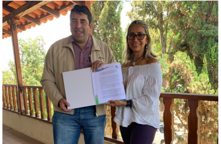
Firma de Convenio en el Municipio de Uriondo

Por su parte la comunidad de Tayasurenda, que alberga al primer Centro de Monitoreo del Área de Vida de Guajukaka, acogerá a nuestros monitores locales que recorren kilómetros de bosque para registrar datos, y recaudar información sobre el estado de esta Área Protegida.