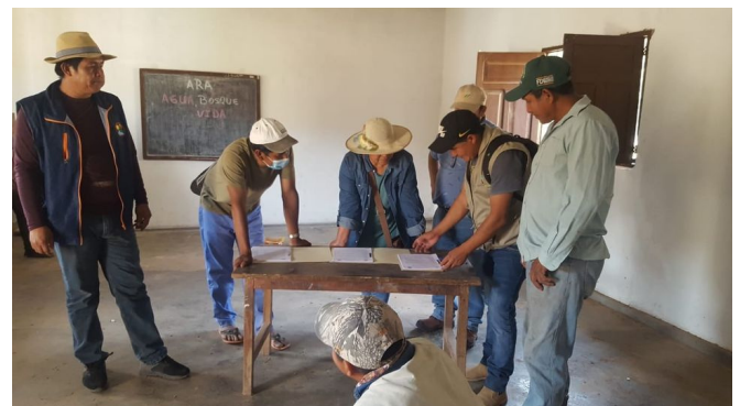
Firma de Acuerdos en Charagua