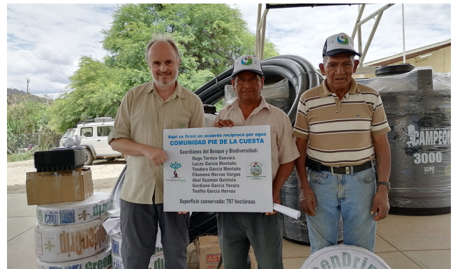
Entrega de incentivos en la Comunidad Oconi