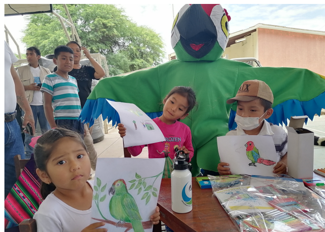
Concurso de dibujo de la Paraba, niños de la comunidad Oconi

Del 17 al 20 de Agosto nuestra escuela ARA, eligió cómo primer destino la ecorregión valles. En esta caso se llevaron adelante escuelas cortas en cuatro municipios de la zona. La primera escuela se organizó en el Municipio de Padilla, allí nuestro equipo compartió experiencias y la metodología detrás de la implementación de mecanismos para la protección de fuentes