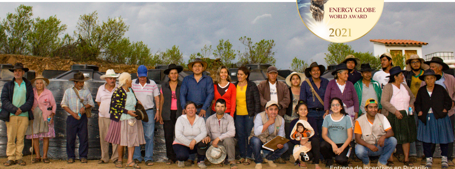
Entrega de incentivos en Pucará