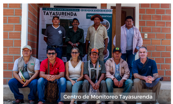
Centro de Monitoreo Tayasurenda