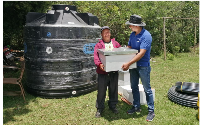
Entrega de incentivos en Pucará