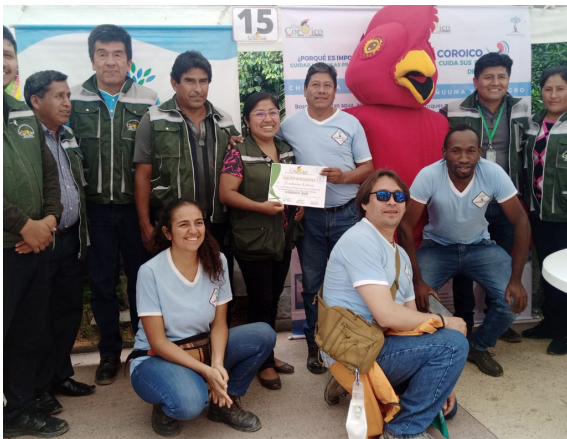
Alcaldesa de Coroico junto al equipo de Natura Bolivia

La campaña denominada “Coroico cuida sus reservas de Agua”, busca concienciar a la población local acerca la importancia de ambas reservas, no sólo por su aporte a la seguridad hídrica del municipio, sino como refugio de biodiversidad y especies de gran valor. El Gobierno Autónomo Municipal De Coroico llevó adelante esta iniciativa con el apoyo de Fundación Natura Bolivia; para ello se creó una identidad visual completa, que incluye su correspondiente logo y material infográfico que acompañe a los eventos oficiales del municipio. Bajo el lema “Bosques que dan Agua, agua que da vida” buscamos difundir la revalorización sus bosques y fuentes de agua.