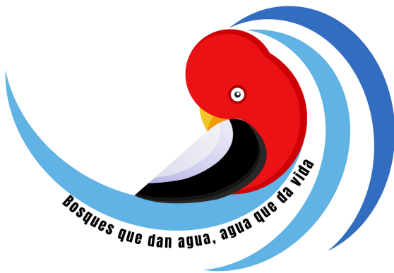
Logo oficial de la Campaña

A inicios del año 2021, el Municipio de Coroico (La Paz) creó la Reserva de Agua de y Bosques Montanos de Chuñuma, con una superficie de 8.613 hectáreas asegurará la protección de las fuentes de agua de Coroico. Esta última acción se suma a las 6.212 hectáreas que componen La Reserva Río Negro y que se creó en el año 2020, ambas reservas de agua son vitales para garantizar este líquido elemento para la población de Coroico y comunidades aledañas.