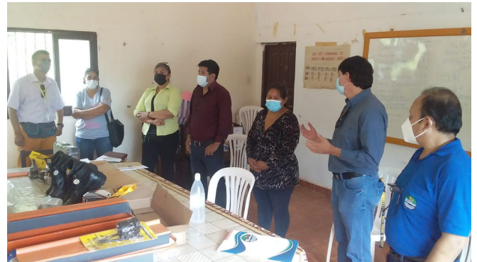
Entrega de incentivos en Caraparí

Además en Charagua finalizamos el año superando las 6.600 hectáreas conservadas con Acuerdos Recíprocos por Agua.