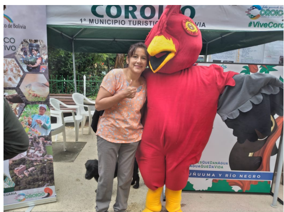
Actividades durante la campaña

Nuestro primer encuentro se dio en la Feria Productiva de Coroico, allí junto al Municipio, creamos un espacio con banners informativos, juegos y material didáctico para informar a las familias que se acercaban a nuestro stand. Nuestro amigo Tunqui, se tomó divertidas fotos con los pequeños, que disfrutaron aprender nuevas cosas.