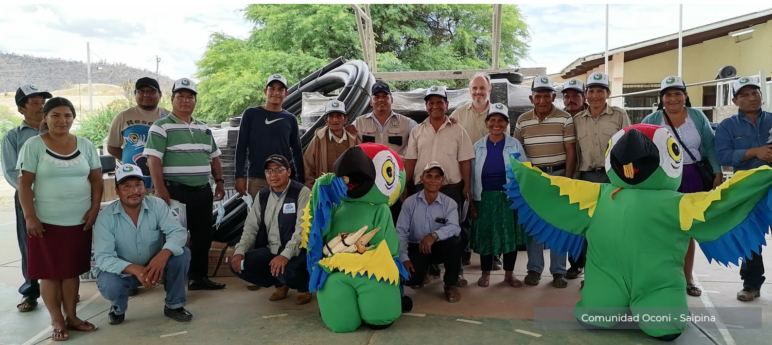
Comunidad Oconi - Saipina