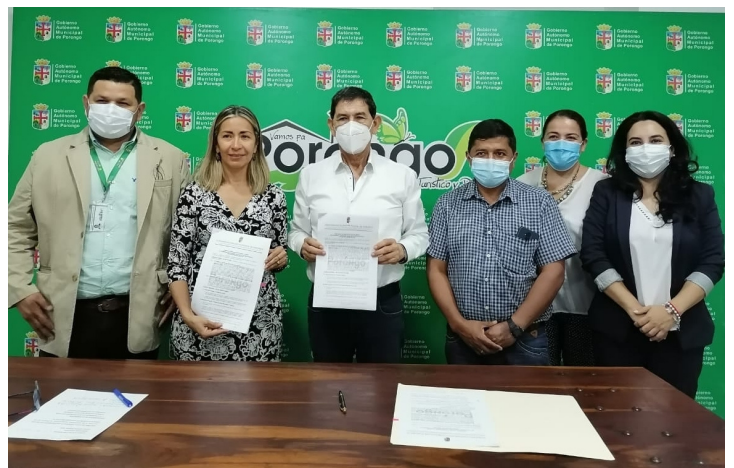
Firma de Convenio en el Municipio de Porongo