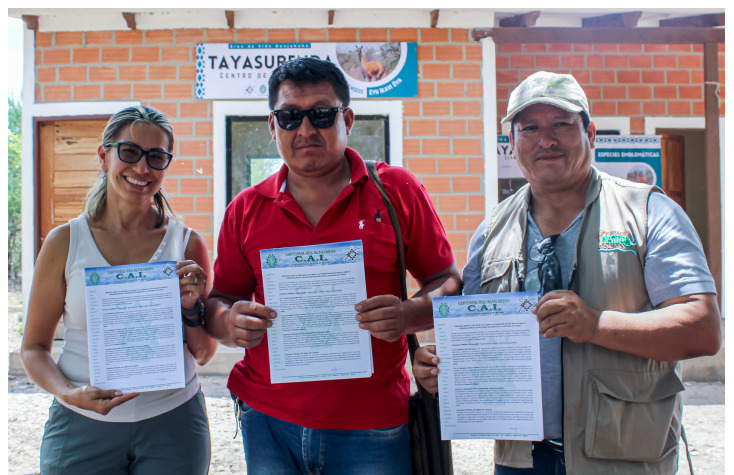
Firma de Convenio en la Comunidad de Tayasurenda