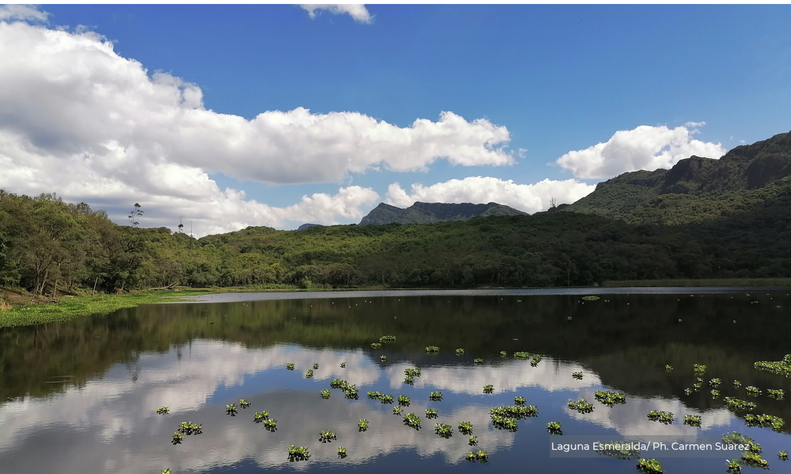
Laguna Esmeralda