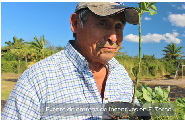
Evento de entrega de incentivos en El Torno

Todo ello gracias al aporte de usuarios del Fondo de Agua El Torno, al Gobierno Autónomo Municipal de El Torno y Fundación Natura Bolivia.