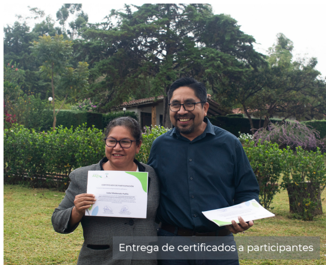
Entrega de certificados a participantes

La primera Escuela de Acuerdo Recíprocos por Agua del año fue un evento presencial de 5 días (del 25 al 29 de abril 2022) realizado en el municipio de Samaipata, donde 26 líderes provenientes de distintos municipios de Bolivia, Ecuador y Colombia, participaron del programa para conocer a fondo los pasos para implementar un ARA y para replicar este modelo de conservación en sus lugares de origen, una vez concluido este proceso de formación.