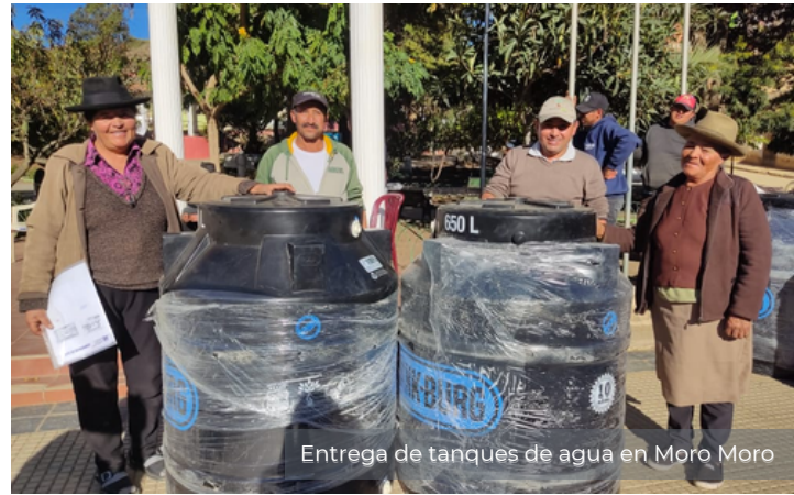
Entrega de tanques de agua en Moro Moro

En la región de los Valles, el Gobierno Autónomo Municipal de Moro Moro, la Cooperativa de Agua y Fundación Natura, entregaron 103 tanques de agua que servirán para el almacenamiento de 62.750 litros de agua. Eso quiere decir que 103 familias podrán contar con agua en sus casa solucionando gran parte del problema de escasez de este líquido vital en el centro poblado de Moro Moro. Estas familias conservan 2.647 hectáreas de bosques.