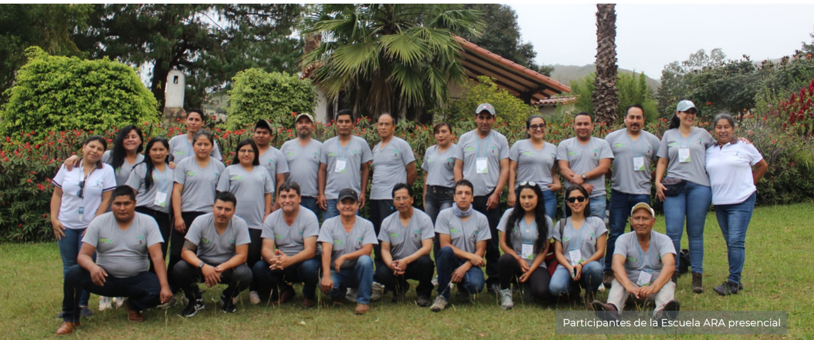
Participantes de la Escuela ARA presencial

Hoy esta plataforma no solo abrirá la posibilidad de acercar la Escuela ARA a personas que no puedan cursarla físicamente, sino posibilitará a los participantes tener una herramienta de consulta en caso de que lo requieran.