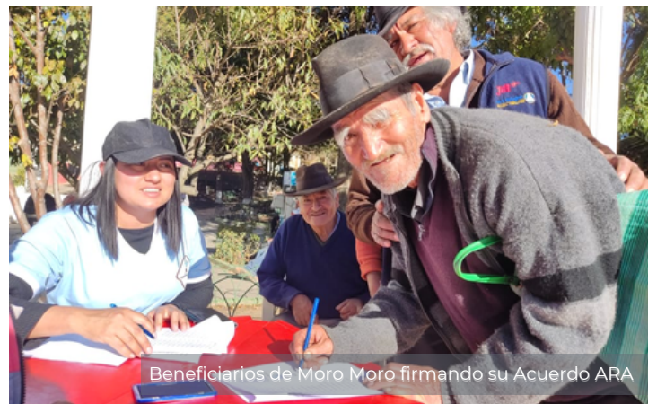
Beneficiarios de Moro Moro firmando su Acuerdo ARA