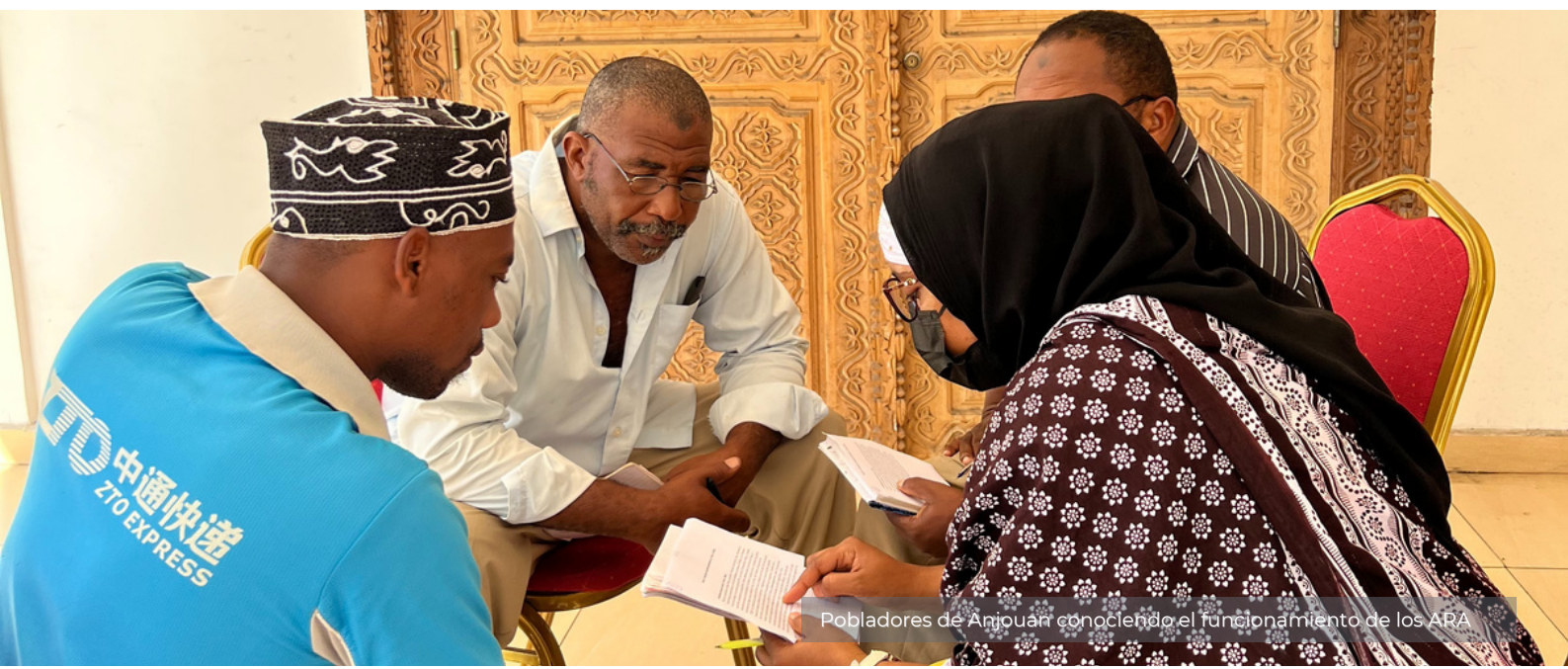
Pobladores de Anjouan conociendo el funcionamiento de los ARA