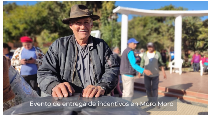
Evento de entrega de incentivos en Moro Moro

De la misma forma el Municipio de Samaipata entregó incentivos a 8 familias que viven dentro del (ANMI) Rio Grande Valles Cruceños, estos nuevos guardianes de bosque firmaron para la conservación de 308 hectáreas de bosques.