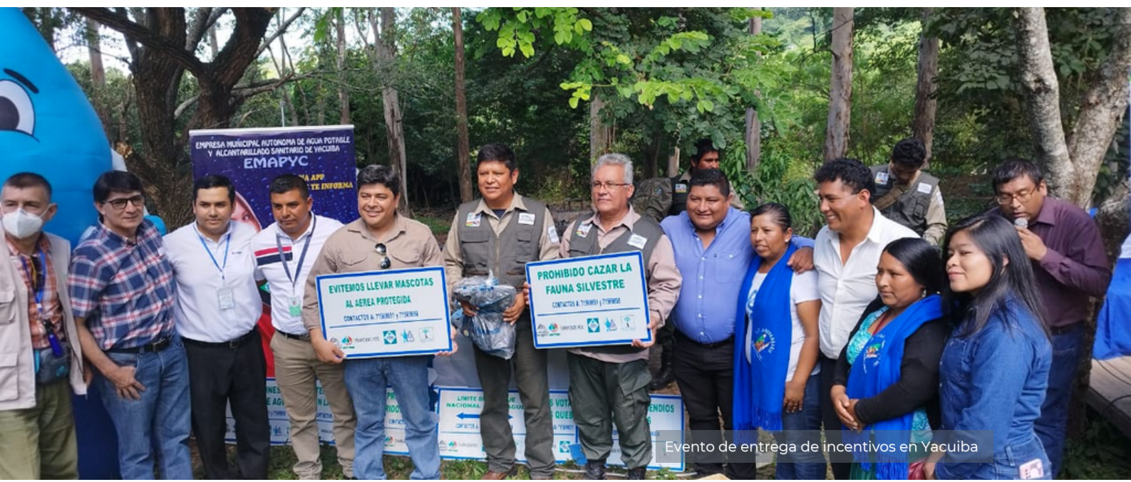
Evento de entrega de incentivos en Yacuiba