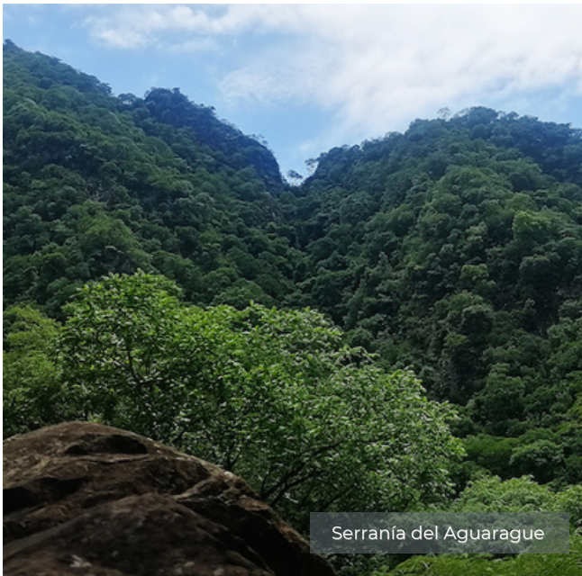
Serranía del Aguaraquë

Esta es la primera vez que un fondo de agua apoya directamente a un área protegida nacional, un logro que vale la pena destacar pues son los propios pobladores de Yacuiba y sus instituciones municipales y de agua que aportan recursos económicos para mejorar las condiciones de trabajo de los guardaparques.