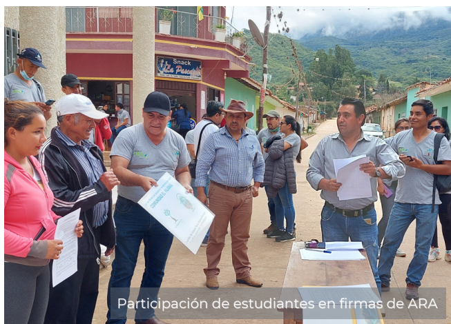
Participación de estudiantes en firmas de ARA

Exploran los bosques y zonas de importancia hídrica, realizan el análisis de la calidad de agua y con todo lo aprendido realizan un diagnóstico y una propuesta de proyecto para aplicarlo en sus territorios, dando paso a la post-escuela, que consta de un seguimiento y asesoramiento a los participantes para la implementación de los ARA en sus regiones.