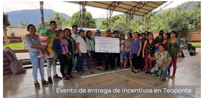
Evento de entrega de incentivos en Teoponte

Un total de 68 familias de las comunidades de Mangopata, Mayaya Uno y Asilahuara con el apoyo del Gobierno Autónomo Municipal de Teoponte firmaron un acuerdo para conservar 1.411 hectáreas de bosques. Estas tres comunidades recibieron material de incentivo para mejorar el acceso al agua.