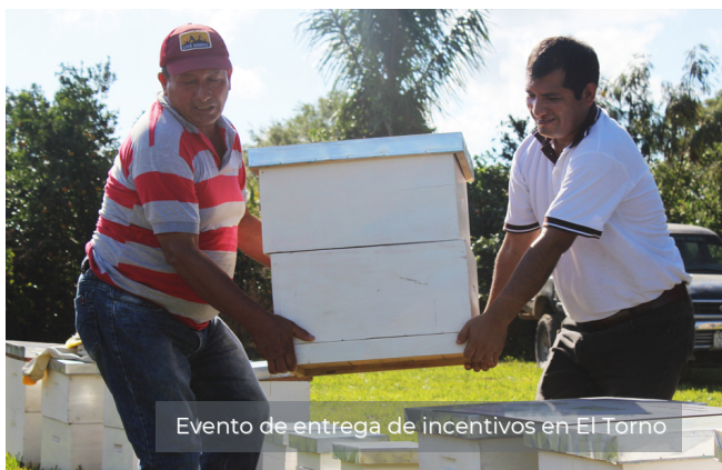
Evento de entrega de incentivos en El Torno