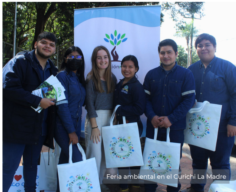
Feria ambiental en el Curichi La Madre