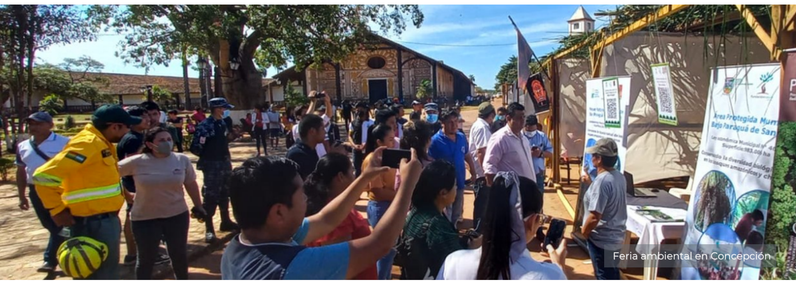
Feria ambiental en Concepción