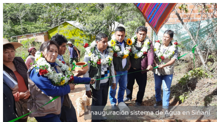
Inauguración sistema de Agua en Siñari