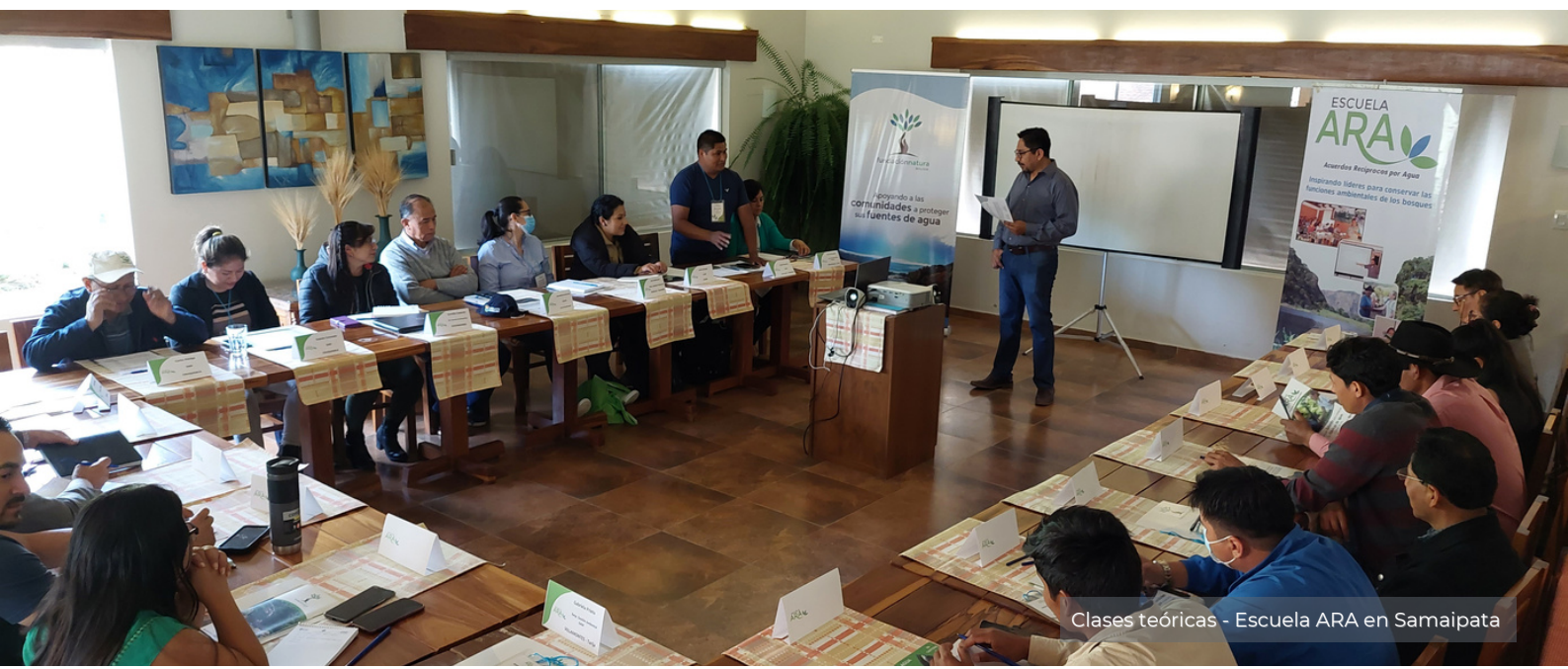
Clases teóricas - Escuela ARA en Samaipata

En ese sentido, Samaipata es un lugar estratégico para realizar este proceso de formación, donde los participantes asisten a