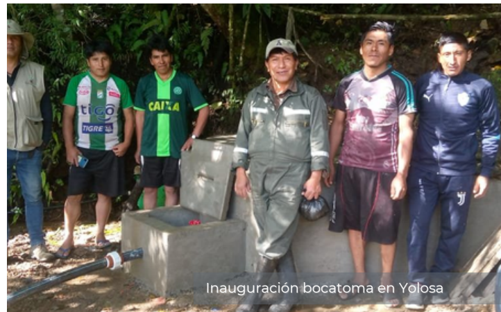
Inauguración bocatoma en Yolosa