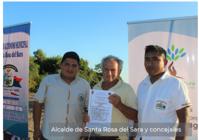
Alcalde de Santa Rosa del Sara y concejales

El Área Protegida fue establecida bajo la categoría de “Área Natural de Manejo Integrado”, lo que concilia la protección de la diversidad biológica y sus recursos hídricos, con el desarrollo sostenible de la población local.