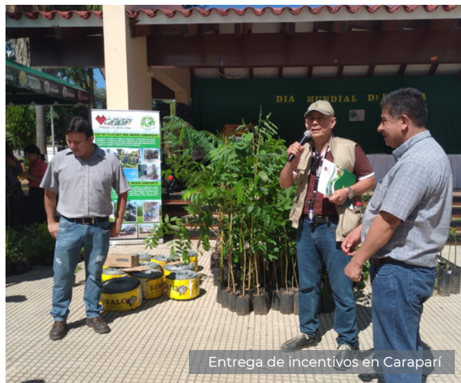
Entrega de incentivos en Caraparí

San José de Chiquitos suma a 77 familias de las comunidades de Taperitas, Quitoquiña y Pororó, como nuevos guardianes de fuentes de agua y bosques. Compromiso que se verá reflejado en la integridad y preservación de 3608 hectáreas de bosque. Gracias al apoyo del Gobierno Autónomo Municipal de San José de Chiquitos, realizamos la firma de Acuerdos Recíprocos por Agua y las entrega de incentivos por ese compromiso asumido por las comunidades quienes recibieron materiales para mejorar la calidad del agua que abastece a sus hogares.