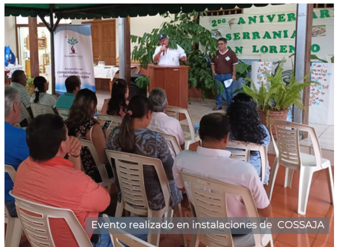
Evento realizado en instalaciones de COSSAJA