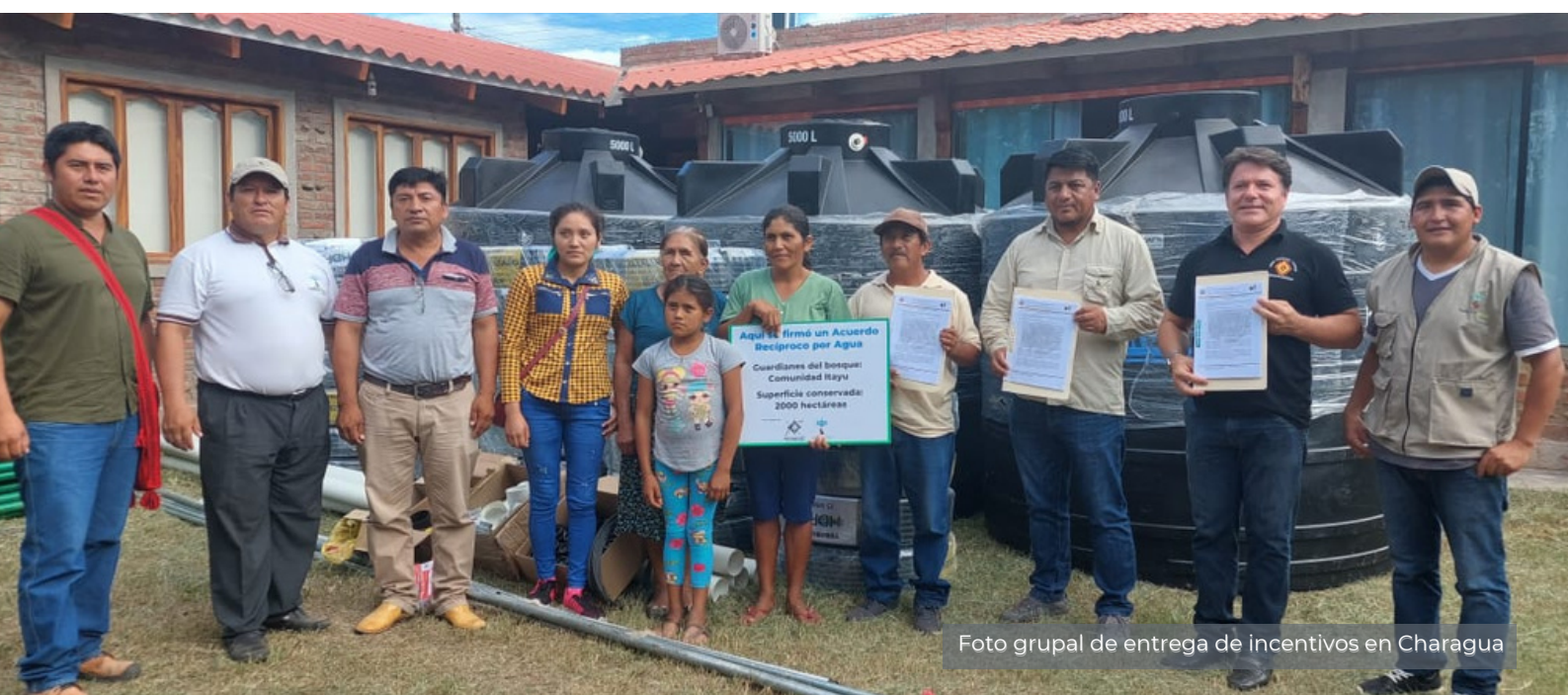
Foto grupal de entrega de incentivos en Charagua