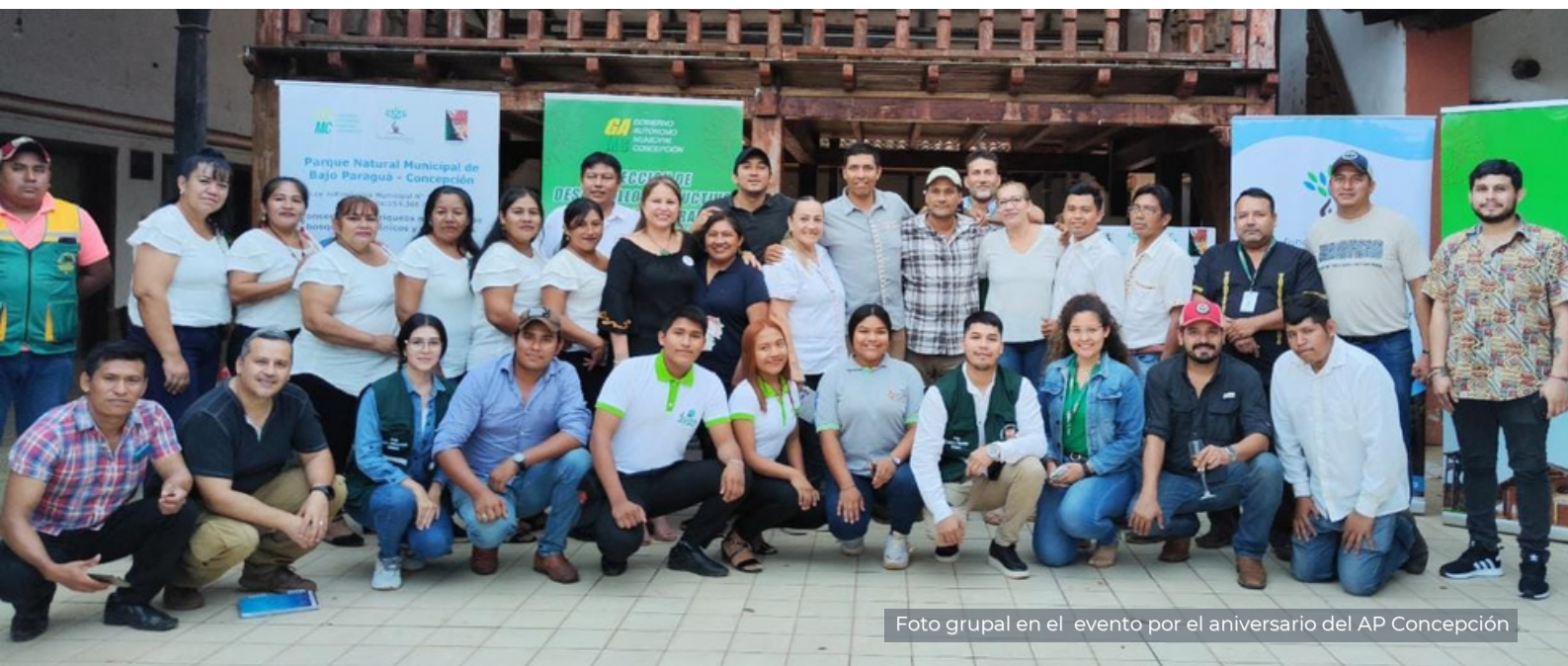
Foto grupal en el evento por el aniversario del AP Concepción

Además durante el evento se presentó el decreto de aprobación del Plan de Manejo del Área, una herramienta clave para su gestión.