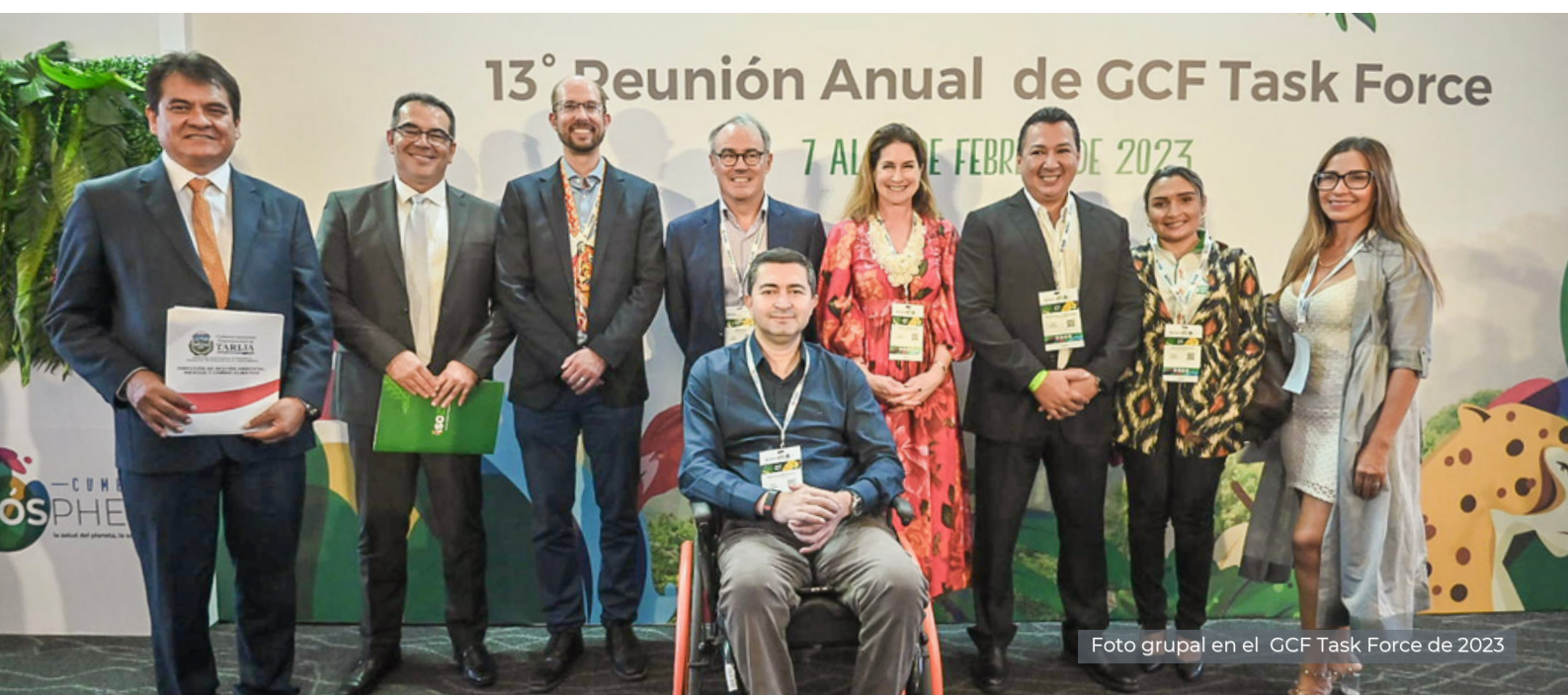
Foto grupal en el GCF Task Force de 2023