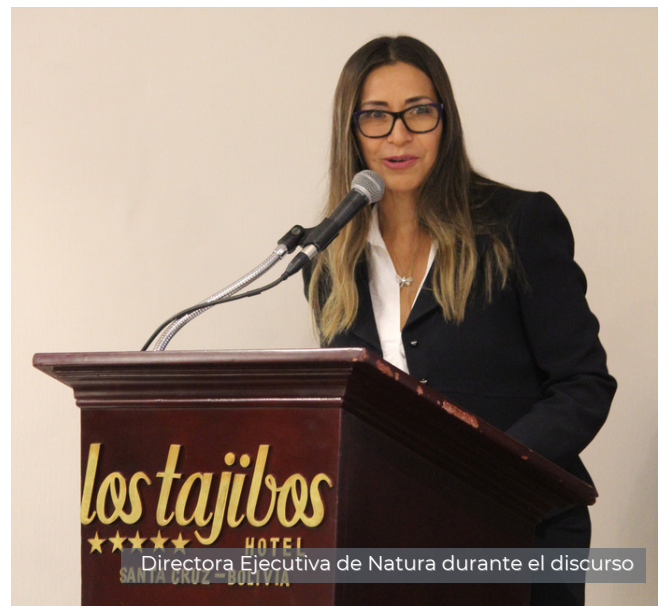
Directora Ejecutiva de Natura durante el discurso

Somos cinco ONG's expertas en agua y saneamiento, conocemos de cerca el gran impacto de la falta de acceso a agua segura en miles de hogares bolivianos. Queremos unir nuestras experiencias y habilidades en un mismo programa llamado "Bolivia con agua", y cuyo principal objetivo es llevar agua y saneamiento para que haya mejor salud, higiene, nutrición y dignidad.