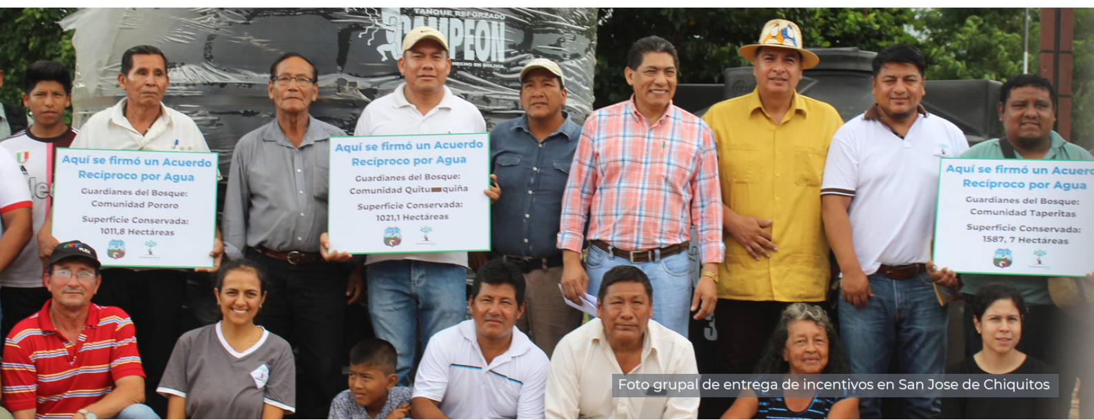
Foto grupal de entrega de incentivos en San Jose de Chiquitos