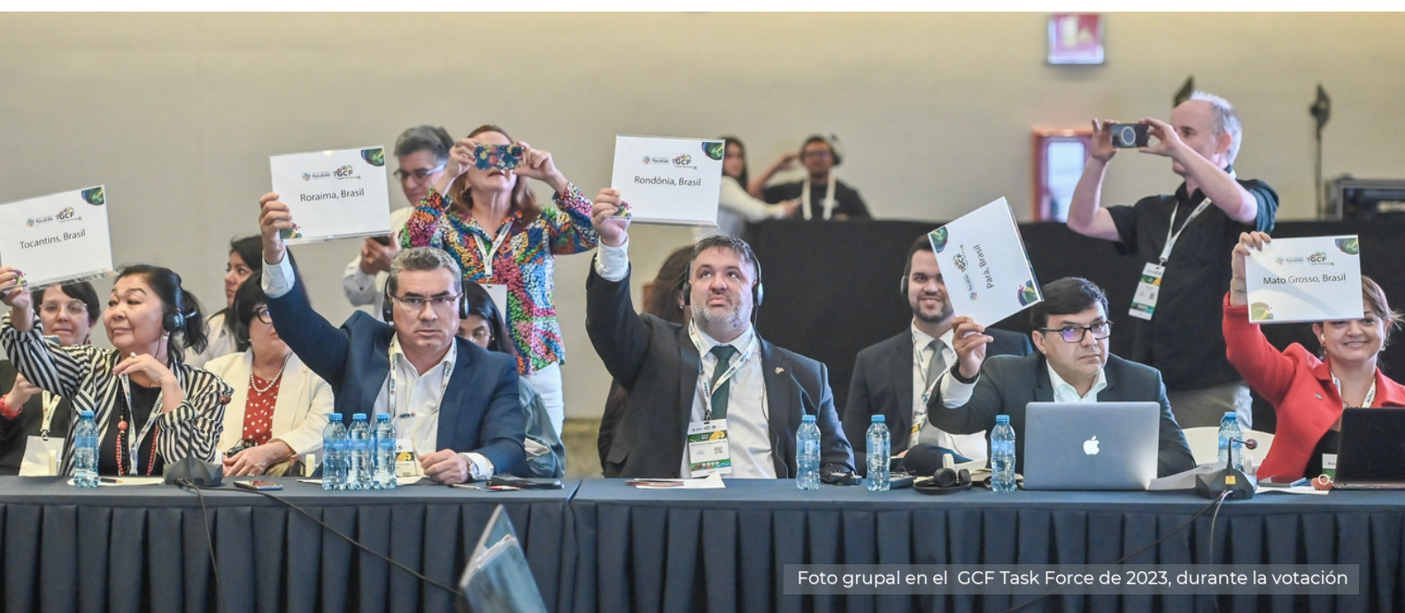
Foto grupal en el GCF Task Force de 2023, durante la votación

Finalmente, tras cumplir con todos los requisitos y pasos para el proceso de adhesión al GCF, y con la recomendación de 2 miembros del grupo (governaciones de Mato Grosso y Acre), las gobernaciones de Santa Cruz, Tarija y Pando fueron aceptadas como miembros plenos en la reunión anual 2023 en Yucatán. Para Bolivia, este es un logro muy importante, que empodera y fortalece a las autoridades subnacionales en la agenda climática del país.