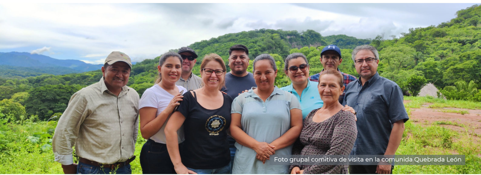
Foto grupal comitiva de visita en la comunida Quebrada León