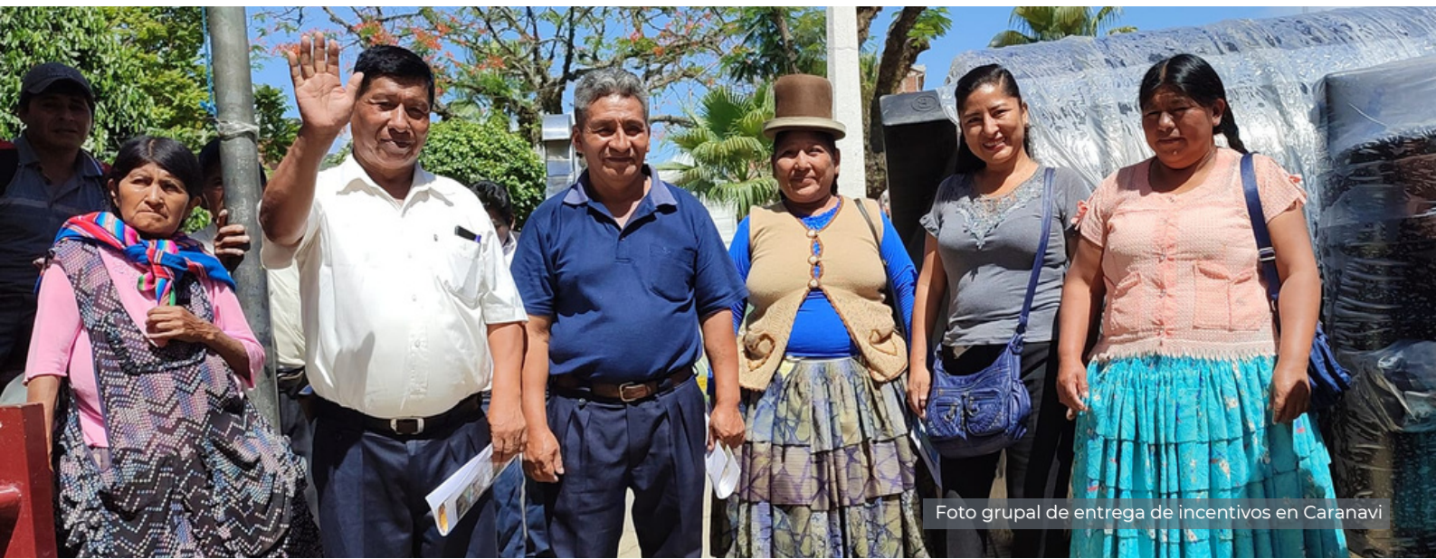
Foto grupal de entrega de incentivos en Caranavi

Un total de 40 comunidades recibieron insumos para mejorar sus sistemas de agua. Entre el material recibido hay tanques de almacenamiento y politubos, lo que permitirá la construcción de sistemas de acceso a agua por gravedad. Todo ello no sería posible sin el trabajo conjunto con el Municipio de Caranavi y sin el compromiso de las comunidades que resguardarán 4717 hectáreas de bosque.