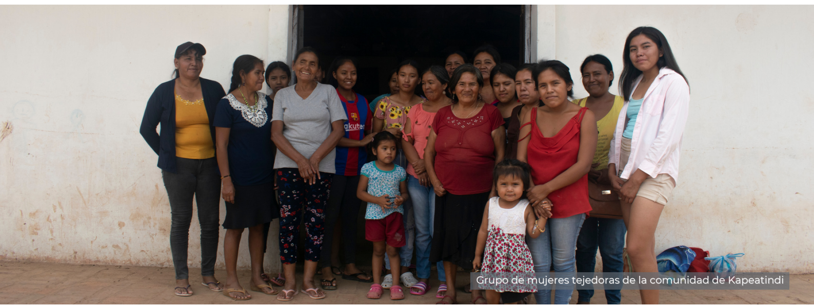
Grupo de mujeres tejedoras de la comunidad de Kapeatindi

A través de Indimbo, más de 50 mujeres indígenas guaraníes se conectan para ser guardianas del Parapetí, protegiendo entre ellas más de 1700 hectáreas de bosques ribereños del Parapetí. Además que busca mantener viva nuestra cultura guaraní con estas piezas tejidas a mano, e impulsa la conciencia ambiental colectiva.