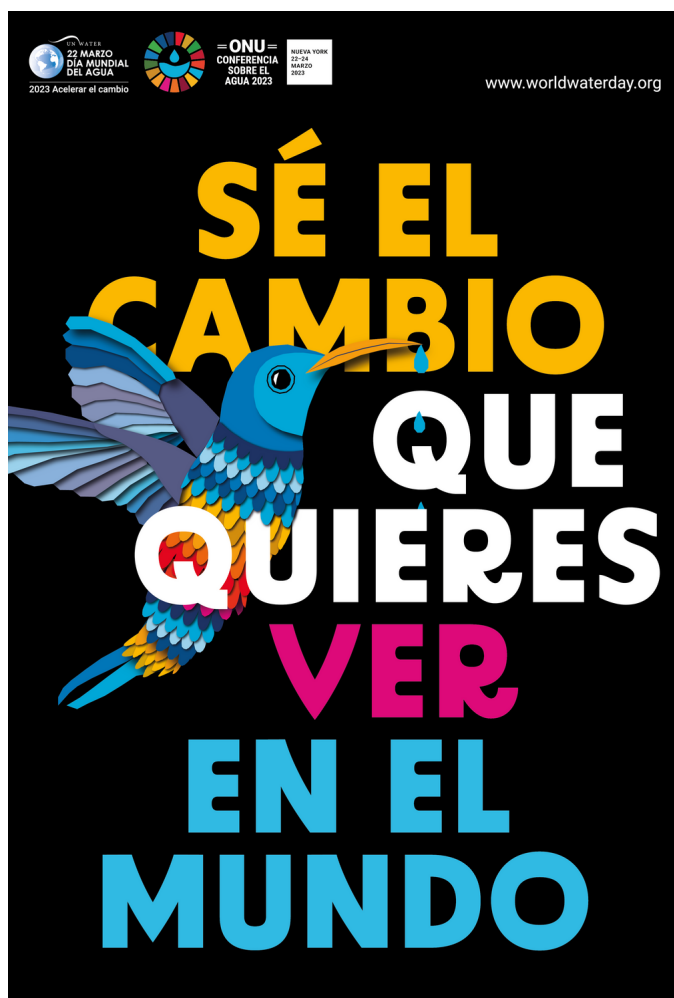
Cartel oficial del Día Mundial del Agua 2023

Celebrada por primera vez en 1993, en cada edición se busca poner el foco en un tema específico. Este año se lanzó la campaña global «Sé el cambio» que alienta a las personas a tomar medidas en sus propias vidas para cambiar la forma en que usan, consumen y gestionan el recurso hídrico. Esta propuesta alienta a la participación local e individual, con pequeñas acciones, que, al ser replicadas por más personas, se puede lograr un cambio significativo y contribuir a una Agenda de Acción del Agua, que busca conseguir compromisos a mayor escala de gobiernos, empresas e instituciones.