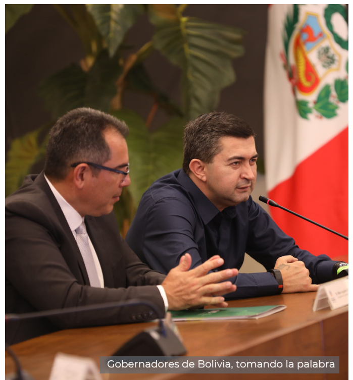
Gobernadores de Bolivia, tomando la palabra

Esta red promueve que los líderes estatales y provinciales, desde los gobernadores hasta los secretarios de agencias clave participen en la lucha contra el cambio climático y que, junto a importantes asociaciones de la sociedad civil y el sector privado, los líderes gubernamentales subnacionales estén bien posicionados para tener un impacto escalable en nuestros problemas climáticos más apremiantes.