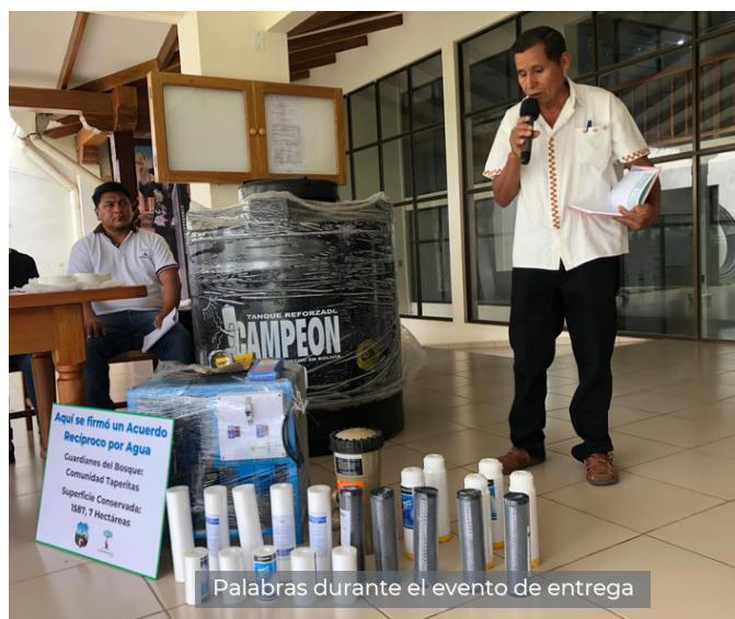
Palabras durante el evento de entrega