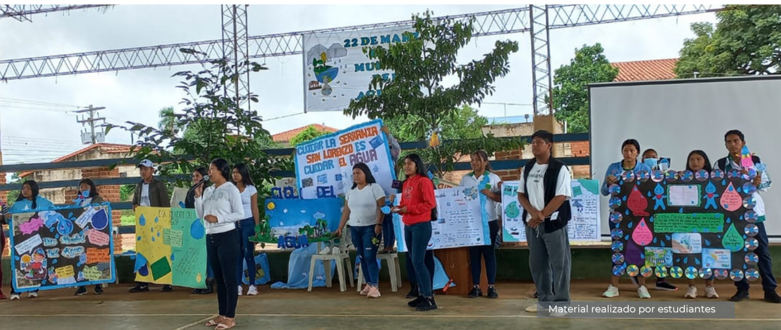
Material realizado por estudiantes