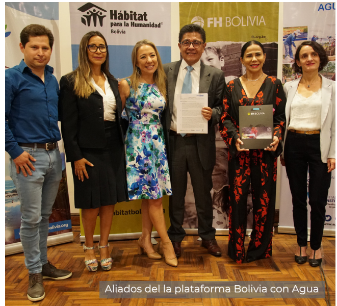
Aliados del la plataforma Bolivia con Agua

El Programa Bolivia con Agua tiene la meta de beneficiar a tres mil familias con acceso a agua segura, recaudar 500 mil dólares, para invertir $us 2 millones. El anhelo de las organizaciones socias es ampliar la red de aliados, sensibilizar a bolivianos para ayudar a otros bolivianos, mejorar la vida de familias para que disfruten el derecho de acceso a agua. Y aportar a la administración correcta del agua para tener cobertura de agua.