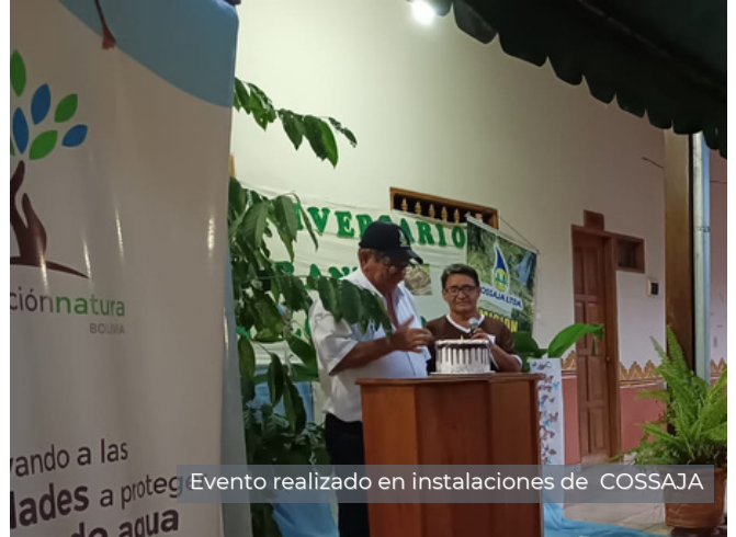
Evento realizado en instalaciones de COSSAJA

Creada el 16 de marzo de 2021 con una superficie de 54.745,46 hectáreas es una de las zonas que contribuye en la generación de agua para el centro poblado de San Javier, comunidades indígenas y propietarios privados de estancias ganaderas, además de albergar en diversidad de especies de fauna y flora.