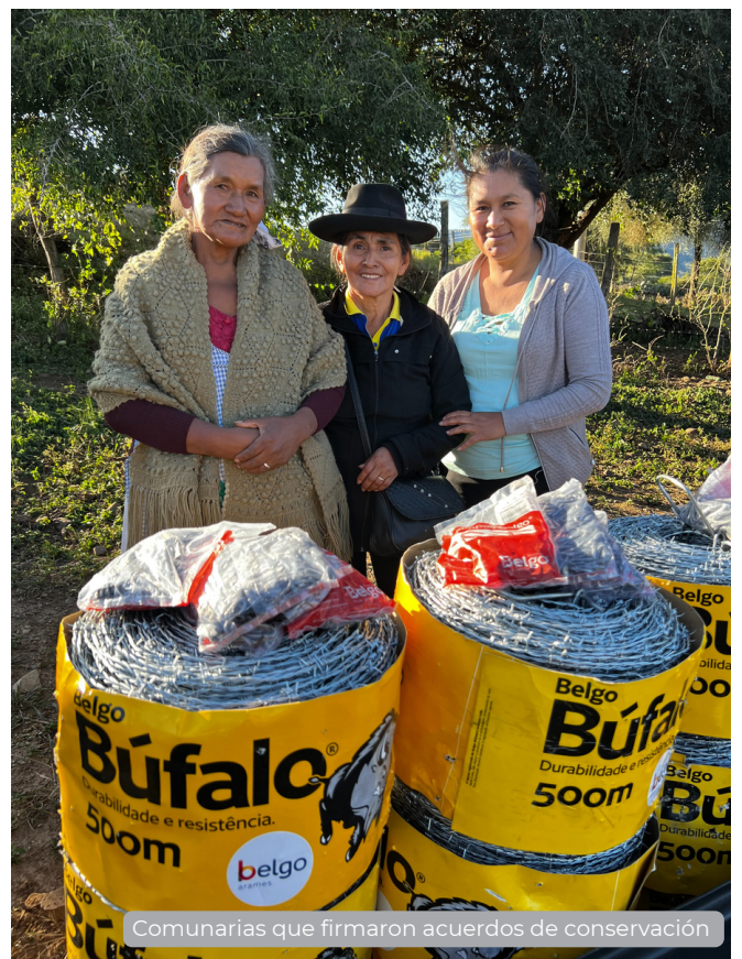
Comunarias que firmaron acuerdos de conservación

Hoy el Trigal no solo cuenta con agua en cantidad y calidad, sino que conserva sus zonas de recarga hídrica para garantizar su provisión de agua a futuro.