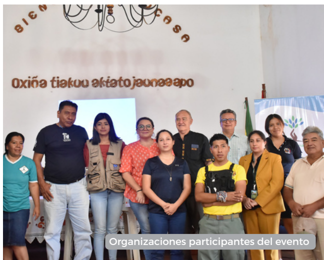
Organizaciones participantes del evento

El día viernes 9 de junio tuvo lugar el evento “Unidos por el Bajo Paraguá”, esta iniciativa que es liderada por dirección de Medio Ambiente y la dirección de Cultura y Turismo -del Gobierno Autónomo Municipal de San Ignacio de Velasco- tiene como objetivo de fortalecer el cuidado de la riqueza natural y cultural que guarda el Bajo Paraguá. Al evento asistieron destacadas instituciones, como los Bomberos de la Dirección de Recursos Naturales (DIRENA), Fundación para la Conservación del Bosque Chiquitano (FCBC), Cooperación Alemana GIZ y Fundación Natura Bolivia.