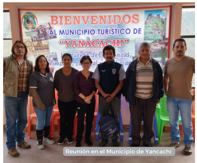
Reunión en el Municipio de Yanacachi

El objetivo final es lograr el compromiso de los municipios de Coroico y Yanacachi, así como de sus comunidades, en el cuidado y la preservación de las áreas protegidas. Este proyecto cuenta con el financiamiento del "Fondo de Alianza para Ecosistemas Críticos" (CEPF), una iniciativa conjunta de la Agencia Francesa de Desarrollo, Conservación Internacional, la Unión Europea, el Fondo para el Medio Ambiente Mundial, el Gobierno de Japón y el Banco Mundial. El objetivo principal es fomentar la conservación de la diversidad por parte de la sociedad.