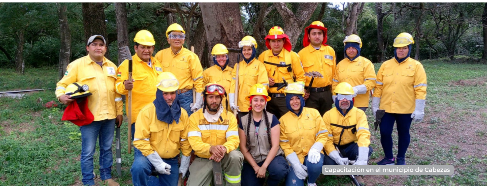
Capacitación en el municipio de Cabezas

Finalmente se capacitó a Abapó y Florida, ambos sectores ubicados en el Municipio de Cabezas, fueron instruidos en el uso adecuado de herramientas para el control de incendios menores. Estas capacitaciones cuentan con una parte teórica y también con una práctica en campo, donde se simula las situaciones de fuego controlado. Esta primera etapa de capacitaciones finaliza con 187 personas capacitadas distribuidos en seis municipios. Hasta el momento un total de 14 cuadrillas conformada por jóvenes, agricultores y comunarios locales ya están listos para responder de forma inmediata ante cualquier incendio menor, evitando que este se agrave.