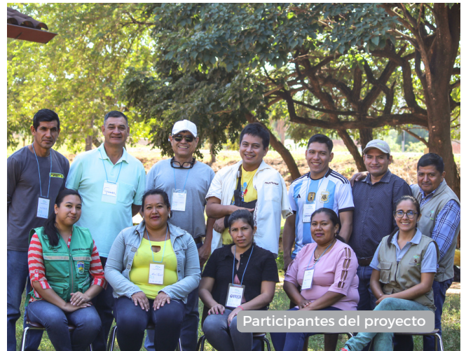
Participantes del proyecto

El programa "Fortaleciendo las Raíces", hace uso de las herramientas de Change The Game Academy-Programa de capacitación elaborado por Wilde Ganzen-, que ha estructurado estos conocimientos, dando lugar dos programas de capacitación completos -movilización de apoyo y recaudación de fondos locales- ambos enfocados en empoderar a las comunidades, permitiéndoles generar sus propias soluciones y recursos.