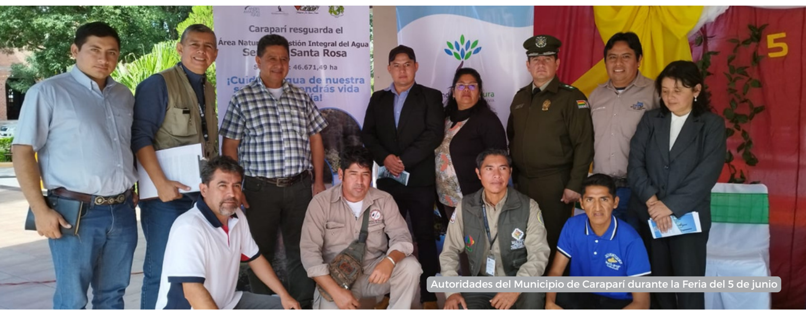
Autoridades del Municipio de Caraparí durante la Feria del 5 de junio