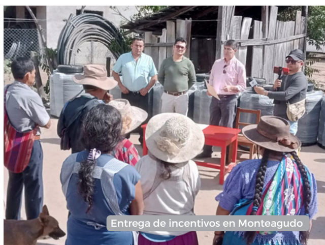
Entrega de incentivos en Monteagudo