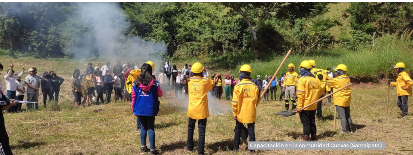
Capacitación en la comunidad Cuevas (Samaipata)