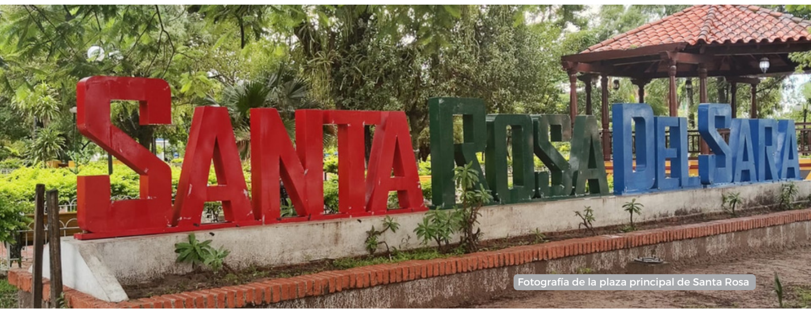
Fotografía de la plaza principal de Santa Rosa

Ante este contexto, la decisión de aportar al fondo municipal del agua se vuelve crucial para garantizar la salvaguarda de las fuentes de agua en la región. Estos fondos reúnen recursos económicos destinados a la conservación y protección de las fuentes de agua, así como a la implementación de medidas para garantizar su disponibilidad a largo plazo.