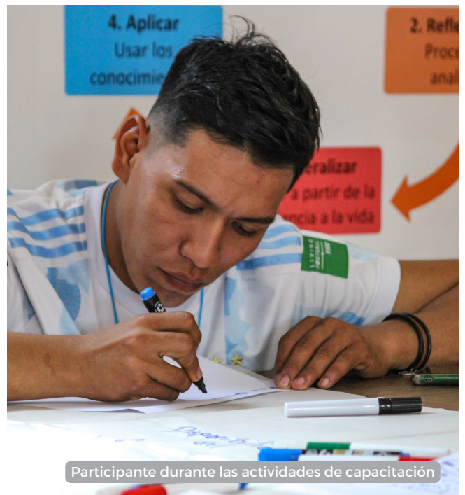
Participante durante las actividades de capacitación

La primera etapa de este proyecto se llevó a cabo en los municipios de Roboré, en el que 19 personas provenientes de las comunidades de Chochis, San Pedro y Santiago fueron capacitadas en herramientas y técnicas pertinentes. Este proceso ha sido enriquecedor tanto para los capacitadores como para los participantes, ya que hemos podido visualizar los desafíos ambientales a los que se enfrentan las organizaciones capacitadas, como la desaparición de fuentes hídricas, la deforestación y la sobreexplotación de los recursos naturales. Ahora inicia la etapa de poner en práctica los conocimientos aprendidos, es hora de visualizar los desafíos y trasladar estas herramientas a la práctica.