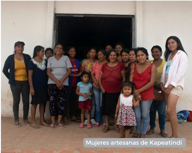
Mujeres artesanas de Kapeatindi