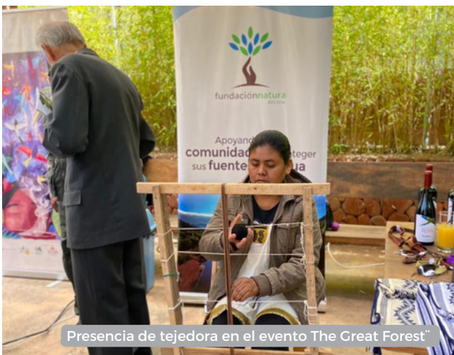
Presencia de tejedora en el evento The Great Forest

La marca Indimbo se expande y ha participado de la recepción organizada por la Embajada Británica, siendo un espacio idóneo para compartir iniciativas sostenibles como Indimbo, en el que mujeres indígenas guaraníes, a través del tejido conservan el bosque y generan recursos propios. La temática del evento "The Great Forests", busca generar conciencia sobre los problemas ambientales y la protección de la biodiversidad.