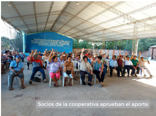
Socios de la cooperativa aprueban el aporte

El Fondo de Agua del municipio de Santa Rosa del Sara, es una plataforma para la coordinación y colaboración entre diferentes actores en la gestión sostenible de los recursos hídricos. Desde sus inicios, el fondo contó con el apoyo de la población local, apoyo que hoy se consolida a través de la aprobación de un aporte mensual que demuestra el compromiso y el apoyo de las ciudadanía de conservar las fuentes de agua de Santa Rosa del Sara.