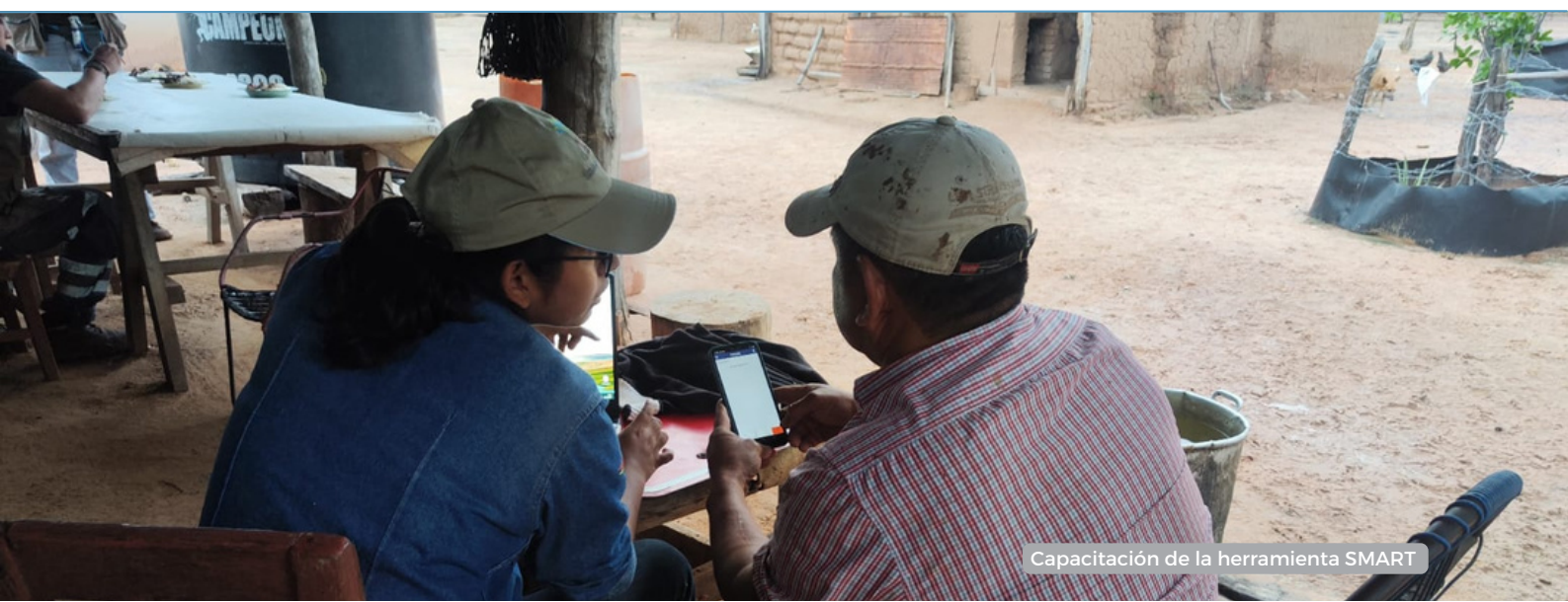
Capacitación de la herramienta SMART