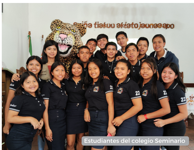
Estudiantes del colegio Seminario

El día viernes 9 de junio tuvo lugar el evento “Unidos por el Bajo Paraguá”, esta iniciativa que es liderada por dirección de Medio Ambiente y la dirección de Cultura y Turismo -del Gobierno Autónomo Municipal de San Ignacio de Velasco- tiene como objetivo de fortalecer el cuidado de la riqueza natural y cultural que guarda el Bajo Paraguá. Al evento asistieron destacadas instituciones, como los Bomberos de la Dirección de Recursos Naturales (DIRENA), Fundación para la Conservación del Bosque Chiquitano (FCBC), Cooperación Alemana GIZ y Fundación Natura Bolivia.