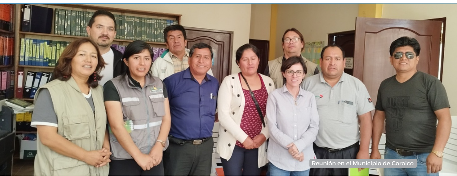
Reunión en el Municipio de Coroico