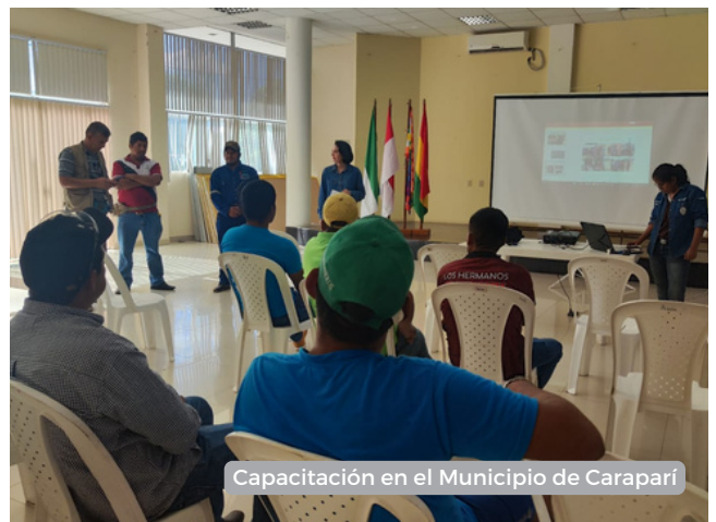
Capacitación en el Municipio de Caraparí

En el Área Protegida de Serranía Santa Rosa, la Unidad Forestal y Medio Ambiente del Municipio de Caraparí, en colaboración con la Fundación Natura y el Comité de Gestión del Área de Conservación Municipal, capacitan a los futuros guardianes. También se realizó la socialización del Área Protegida de Entre Ríos en la comunidad de Moreta, con el objetivo de lanzar una campaña de concienciación y capacitación a 18 monitores en esa área de conservación hídrica.