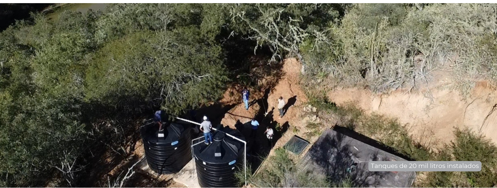
Tanques de 20 mil litros instalados