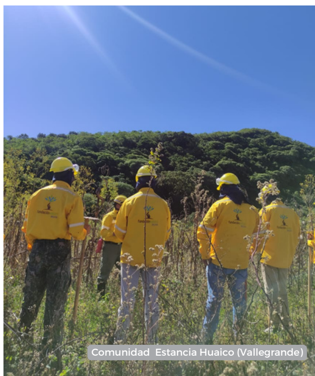
Comunidad Estancia Huaico (Vallegrande)

En Samaipata, la comunidad de Cuervo, fue capacitada una cuadrilla. De la misma forma en Vallegrande se capacitó a las comunidades de Estancia Huaico y Loma Larga. El Municipio de Postrevallye fue capacitada la comunidades de San Marcos; y finalmente se suma el Municipio de Moro Moro, con las comunidades de La Laja y Alto Veladero.