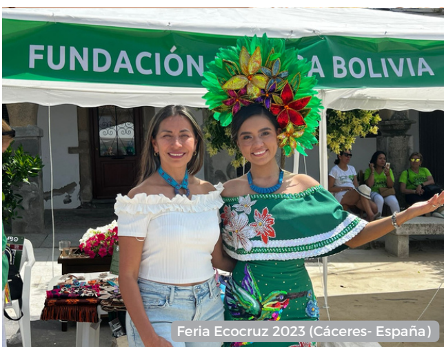
Feria Ecocruz 2023 (Cáceres- España)

Los días 16, 17 y 18 junio Indimbo estuvo presente en la Feria Internacional Ecocruz 2023 en Santa Cruz de la Sierra (Cáceres-España), esta feria es un evento de hermanamiento entre la comarca que vio nacer a Ñuflo de Chavez y la ciudad de Santa Cruz de la Sierra (Bolivia), ambas con el mismo nombre. Este evento contó con la participación de residentes bolivianos en España y de los propios locales, que tuvieron la oportunidad de conocer la iniciativa de Indimbo y adquirir una de estas joyas del bosque.