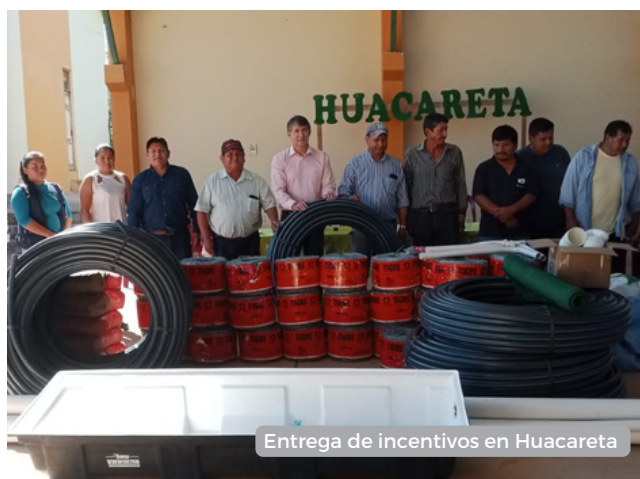
Entrega de incentivos en Huacareta

En el Chaco nos trasladamos hasta el Municipio de Lagunillas, allí la comunidad de Tacete ha sido beneficiada con incentivos productivos, a cambio esta comprometida comunidad asegurará el cuidado de 565,87 hectáreas. En el Municipio de Boyuibe la Comunidad de Laguna Camatindi conserva 1056 hectáreas de bosque en en la región chaqueña. En el Municipio de Huacareta, las comunidades de Huirisai, Casa Alta, Ñacamiri y San José reciben incentivos productivos en manejo ganadero y riego. Finalmente el junto al Municipio de Monteagudo se coordino la entrega de incentivo para la comunidad el Puente, que resguardará 593 hectáreas de bosque