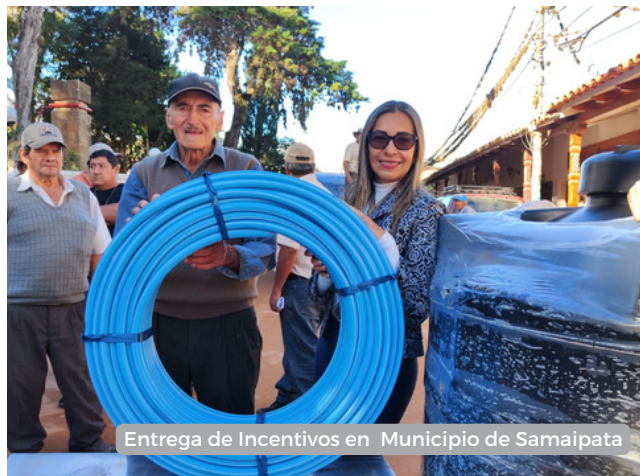
Entrega de Incentivos en Municipio de Samaipata

El Gobierno Municipal Moro Moro, el Concejo Municipal, la Cooperativa de Agua Local y la Fundación Natura Bolivia, han logrado entregar 123 tanques de plástico, capaces de almacenar 90 mil litros de agua. Todo esto ha sido posible gracias a 58 familias que han decidido preservar un total de 2817 hectáreas de bosque, contribuyendo directamente a la conservación de nuestras fuentes de agua. Siguiendo esta misma línea, en el Municipio de Samaipata impactamos positivamente en 75 familias rurales, mediante la entrega de incentivos productivos, como cajas de apicultura y plantines frutales, hemos fortalecido la economía de estas familias y facilitado el acceso al agua a través de tanques de almacenamiento y politubos.